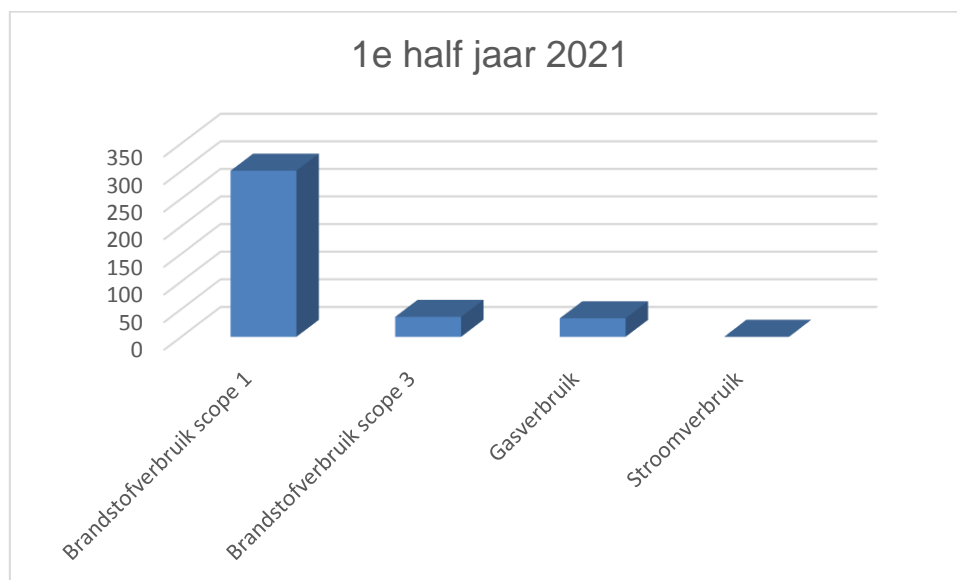
Figuur 1: CO 2 emissie 1 e half jaar 2021 per soort fossiele brandstof

In het eerste half jaar van 2021 is er totaal 924.103 km gereden met de bedrijfsvoertuigen. Hiervan zijn 31.248 km's met de elektrische voertuigen afgelegd.