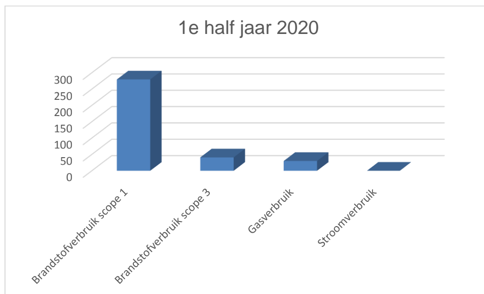
Figuur: CO 2 emissie 1 e half jaar 2020 per soort fossiele brandstof

In het eerste half jaar van 2020 is er totaal 895.277 km gereden met de bedrijfsvoertuigen. Hiervan zijn 26.656 km's met de elektrische voertuigen afgelegd.